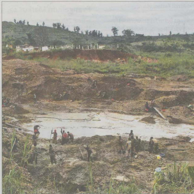
Armes reiches Land: Die Ausbeutung der Ressourcen des Landes, wie hier in einer Goldmine, erfolgt meist unter primitivsten Bedingungen.

Weiterhin werden die Minen in der Kivu-Region im Osten des Landes unter primitivsten Bedingungen per Handarbeit ausgebeutet. Diese Minen stehen unter der Kontrolle der staatlichen Armee oder werden von illegalen bewaffneten Milizen beherrscht. Sie alle schmuggeln die Rohstoffe in die Nachbarstaaten, von wo aus sie über Zwischenhändler auf den Weltmarkt gelangen und vor allem nach Asien verkauft werden. Profitieren können von diesem Handelsweg vor allem korrupte kongolesische Politiker, Geschäftsleute und internationale Mittelsmänner, während den kongolesischen Arbeitern und der Bevölkerung der Zugang zum Reichtum ihres Landes verwehrt bleibt. Durch den illegalen Rohstoffhandel halten sich mafiöse Wirtschafts- und Herrschaftsstrukturen am Leben, die die Ausplünderung der natürlichen Ressourcen systematisch vorantreiben. Ihre Macht setzen die staatlichen Militärs, aber auch die Milizen mit Waffengewalt durch, sie plündern und vergewaltigen in großem Ausmaß, um die Kooperation der Bevölkerung zu erzwingen.