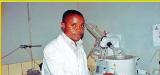
Ausbildung Pharmakologie, Uni Kinshasa Ausbildung Krankenpflege

unterstützt den Austausch und die Partnerschaft zwischen Gruppen und auch Einzelpersonen der verschiedenen Kulturen.