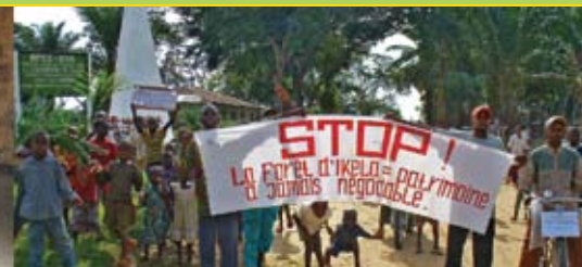
Gegen die Regenwald-Abholzung Brückenbau in Bokungu - Ikela