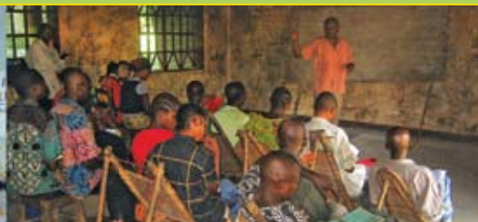
Berufschule Krankenpflege in Ikela Grundschule Moma Ikela