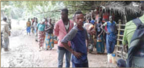
Fliegende Händler am Mokobe - Fluss