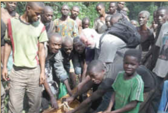
Um einen Stamm zu ziehen braucht es 100 Hände im Gleichklang

„Meine Hilfe zählt“, Konto 220012 bei der Sparkasse Trier (BLZ 58550130), IBAN DE47585501300000220012 oder Konto 191919 bei der Volksbank Trier (BLZ 58560103), IBAN DE67585601030000191919. Im Verwendungszweck bitte die Projektnummer angeben, damit die Spende auch dem gewünschten Zweck zufließen kann. (in unserem Fall Nr. 22881 für das Buch oder 48224 für die Brücken). Spenden ohne Projektangabe fließen in einen gemeinsamen Topf, der unter allen Initiativen verteilt wird. Falls eine Veröffentlichung des Spendernamens im TV gewünscht wird, bitte ein „X“ auf dem Überweisungsformular eintragen. Bis zu einer Summe von 200 Euro wird der Einzahlungsbeleg als Spendenquittung anerkannt. Ist eine separate Quittung erwünscht, bitte Adresse angeben. Hat ein Projekt bereits vor Buchung das Spendenziel erreicht, kommt der Betrag anderen Projekten zugute.“ (volksfreund). Herzlichen Dank für alles Interesse und Unterstützung, auf eine erfolgreiche Spendenaktion!