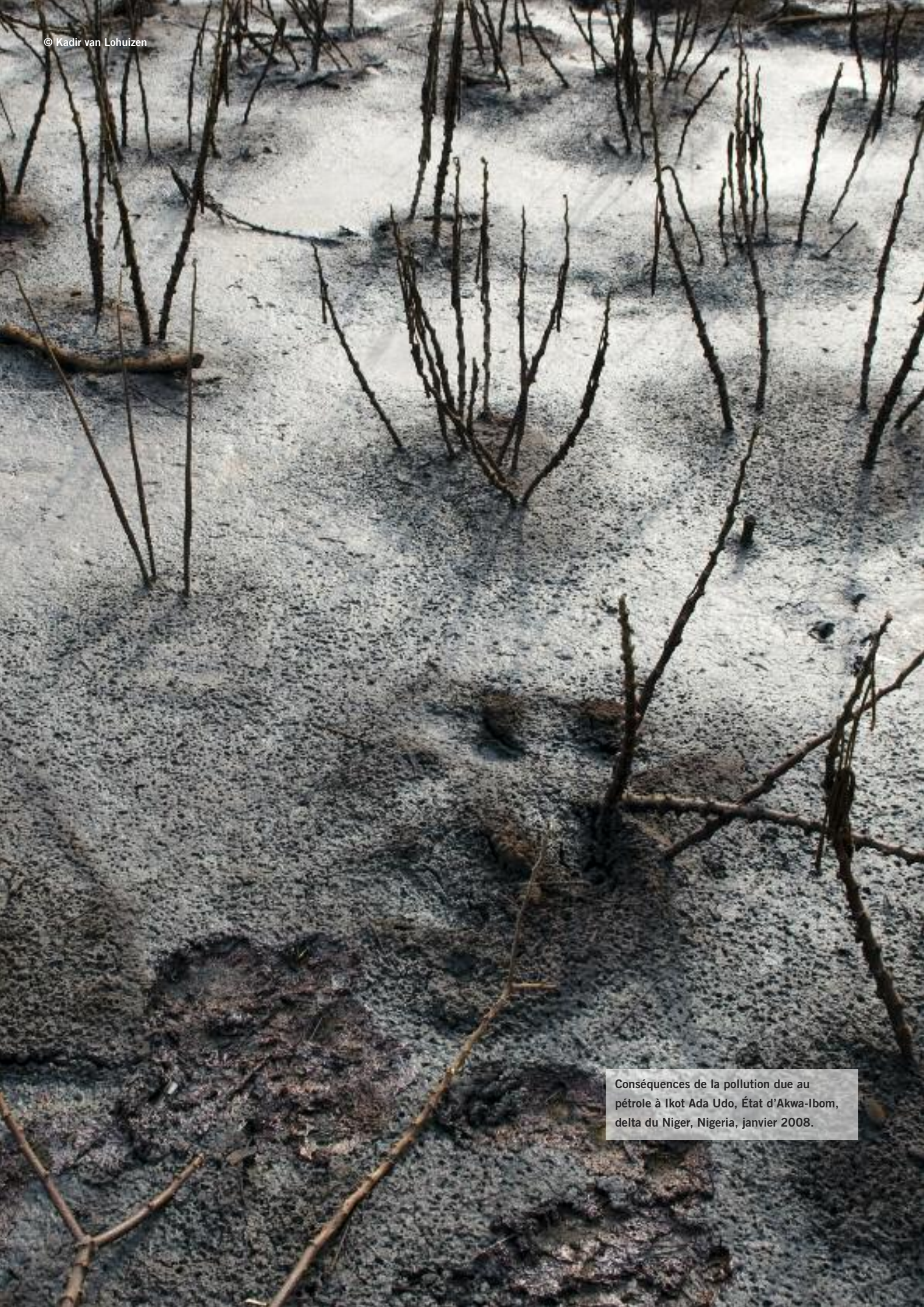
Conséquences de la pollution due au pétrole à Ikot Ada Udo, État d'Akwa-Ibom, delta du Niger, Nigeria, janvier 2008.